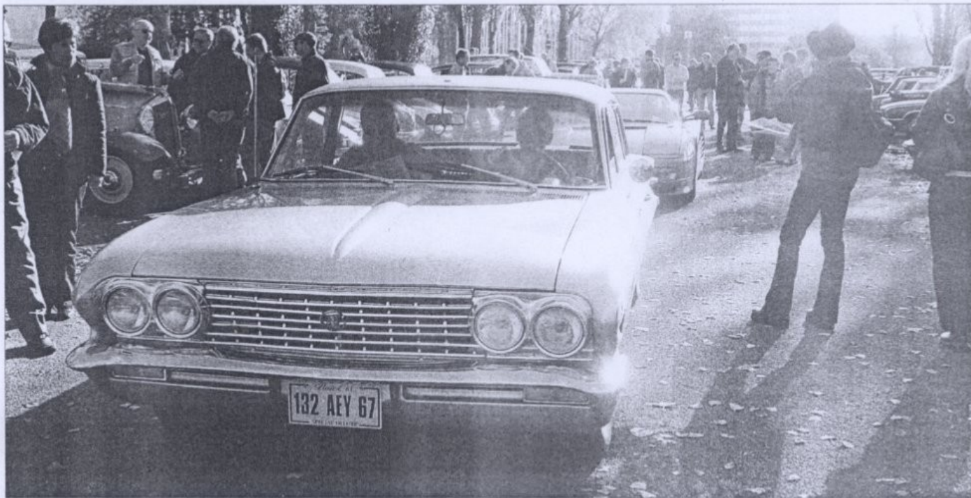
Une Buick Special Deluxe de 1961 précédant une Ferrari Testarossa. La réunion mensuelle de Strasbourg : le rendez-vous de tous les passionnés.